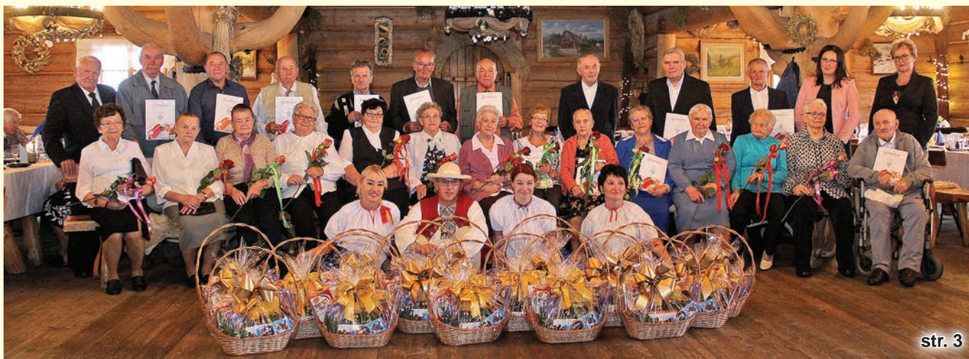
Diamentowi i Złoci Jubilaci