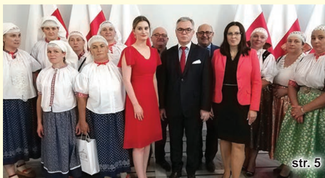
Nasze KGW z wizytą w Sejmie